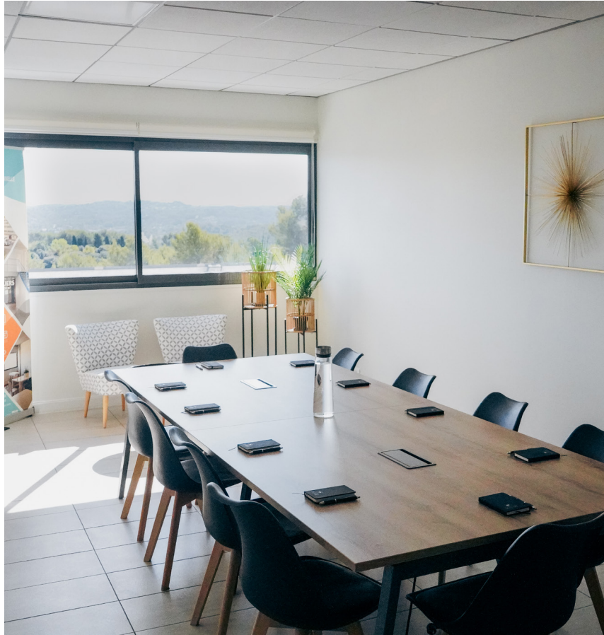
Salle de réunion Twily