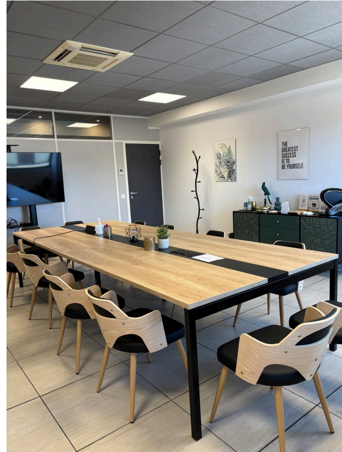
Salle de réunion Badiane