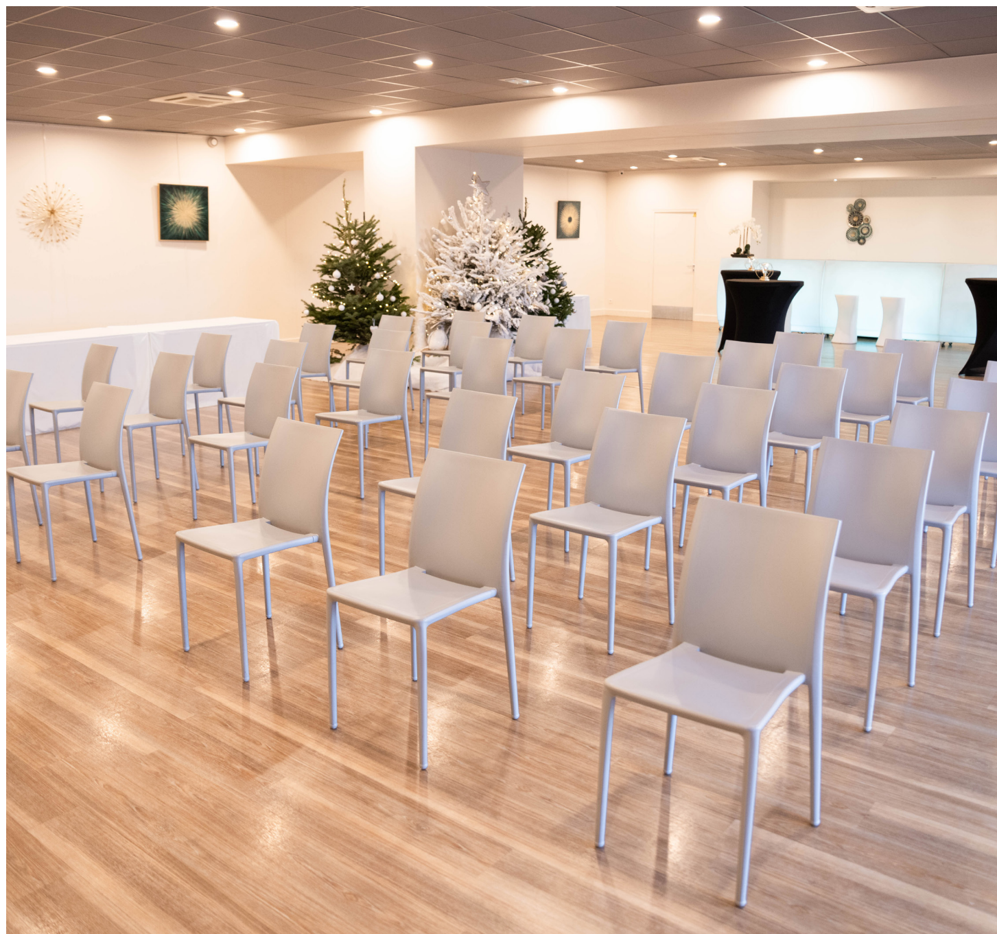
Fête de fin d'année