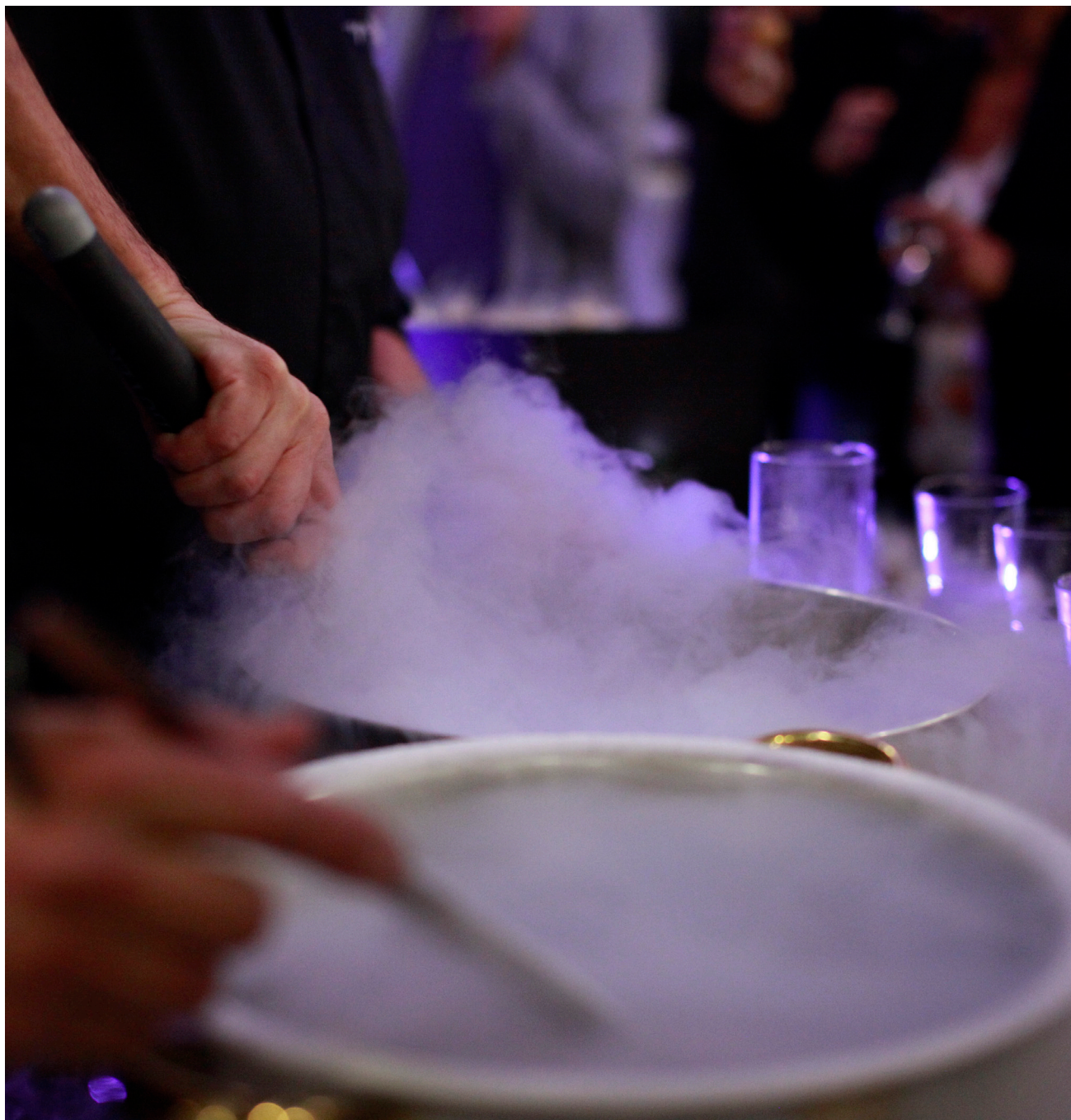
Showroom, lancement de produit