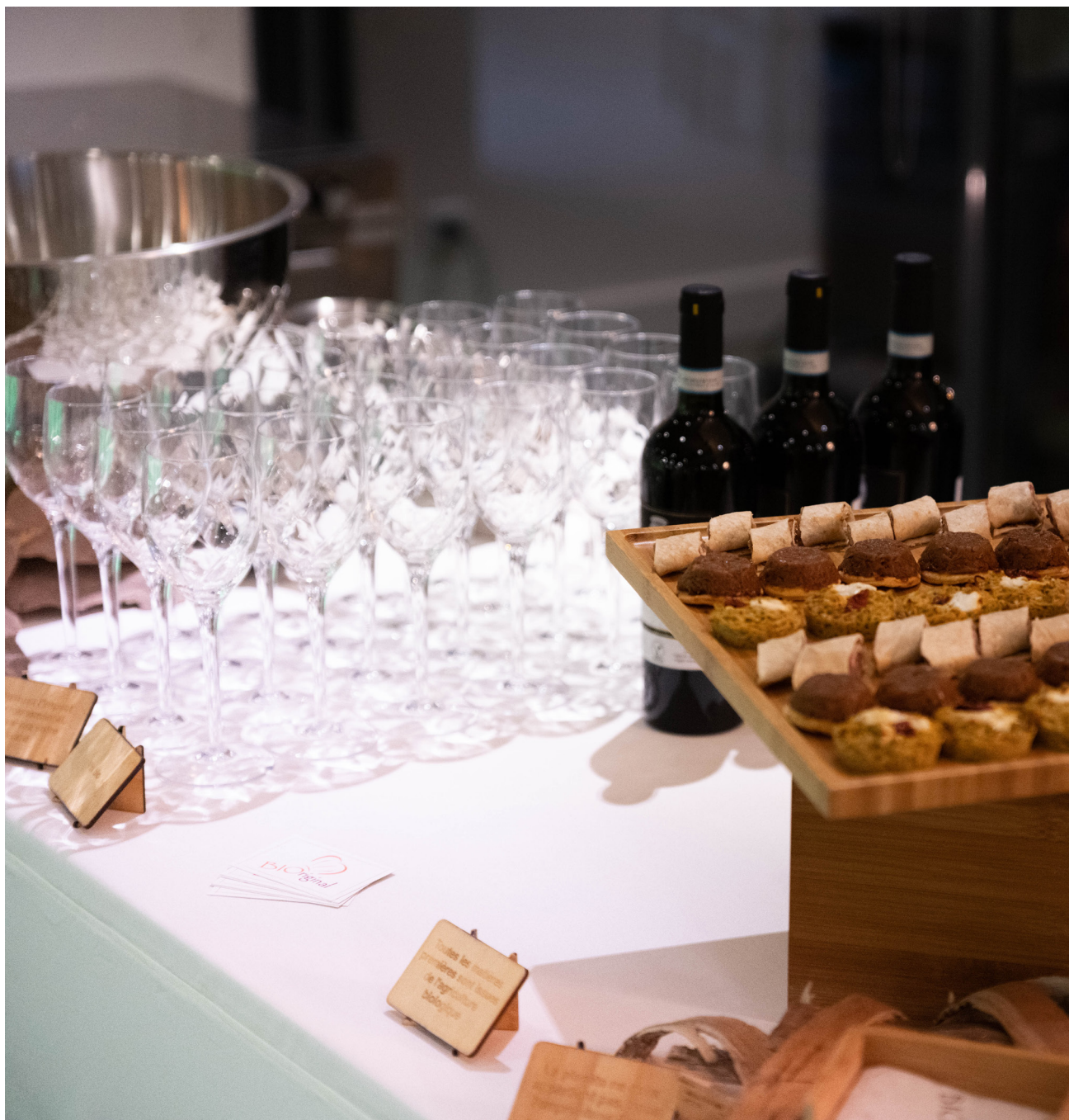
Cocktails déjeunatoire, dinatoire