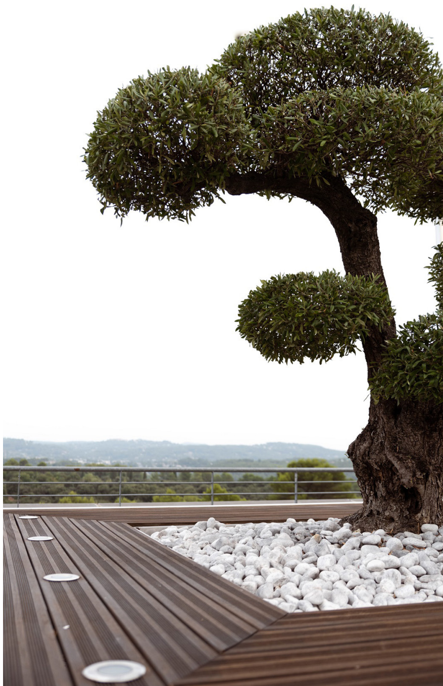
L'Olivier du Cube Réceptions