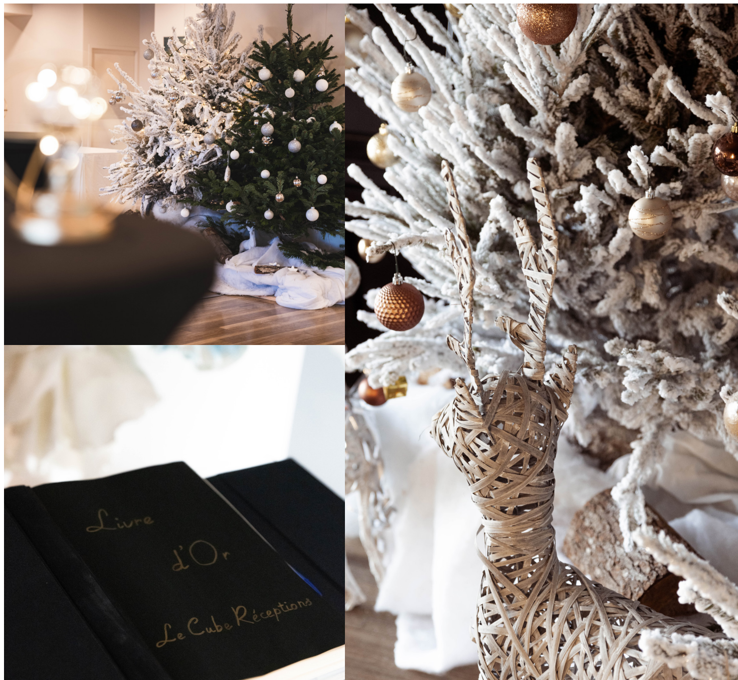
Fête de fin d'année