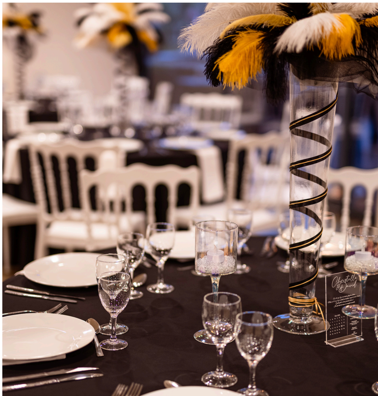
Soirée de gala, cabaret