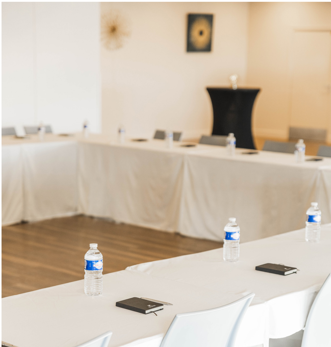
Le Cube Réceptions